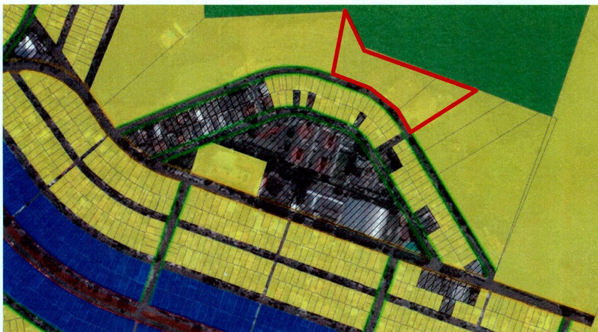
Figura 2: Mapa da proposta de Lei 228 em que as chácaras em vermelho pertencentes à Unopar não foram incluídas a ZE 1.2.

Diante desse parecer, é solicitada a inclusão das chácaras 6, 7 e 8, indicadas no desenho abaixo, pela Zona Especial Campi Universitários ou ZE-1.2 por pertencer a Creare/UNOPAR e abrigar atividades vinculadas ao ensino. Cabe aqui ressaltar está em andamento a atualização do EIV, o qual requisita o parcelamento das chácaras em lotes urbanos de acordo com a orientação do corpo técnico do IPPUL. A edificação atende os parâmetros construtivos da zona atual ZR-3, conforme projeto aprovado por uma atividade é desconforme.